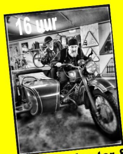
DC Snakebuster & 1/2 Blind Willie

Barbecue vanaf 17u, 20€ PP Geld overmaken op VRA: BE12 9795 2518 6192 +vermelding naam en aantal personen. (Inschrijving verplicht, pitjebeelen@gmail.com)