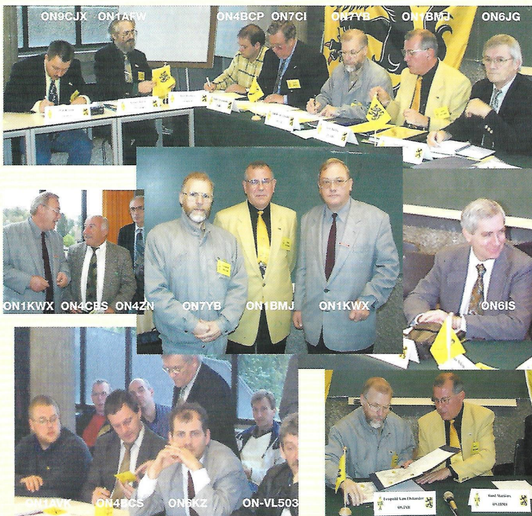
Uitwisseling van het ondertekende protocol

Verantwoordelijke uitgever: Gust Mariën, ON1BMJ - Brusselsesteenweg 113 - 2800 Mechelen