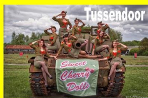
Sweet Cherry Dolls